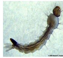
Larva 05 dias