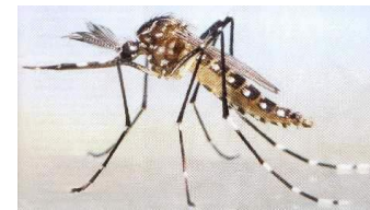
Mosquito Vive até 40 dias