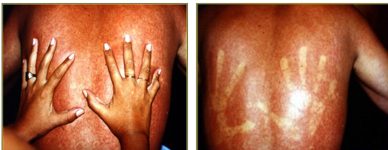
(Manchas vermelhas: O exantema desaparece sob pressão)