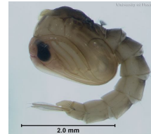
Pupa De 02 à 03 dias