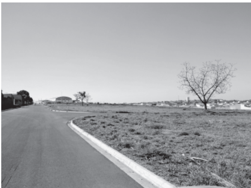
Área destinada ao Distrito de Micro e Pequenas Empresas de Indaiatuba

Pelo projeto pretende-se em caráter excepcional, a realização da alienação do imóvel de forma parcelada pelo próprio Poder Público, uma vez que, desde setembro de 2008, tentou-se sem